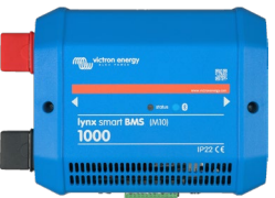
Lynx Smart BMS 1000 A