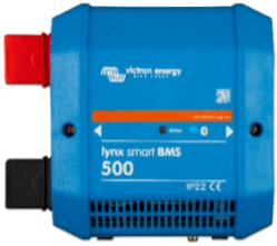
Lynx Smart BMS 500 A