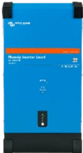
Convertisseur Smart 12/3000