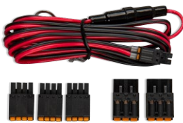
Accessori in dotazione con il GlobalLink 520.